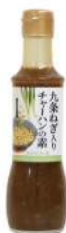
九条ねぎ入りチャーハンの素