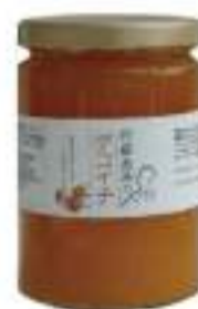
阿蘇高原のデコイチジャム