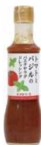
トマトとバジルのパスタサラダドレッシング