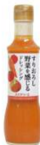
トマトとバジルのパスタサラダドレッシング