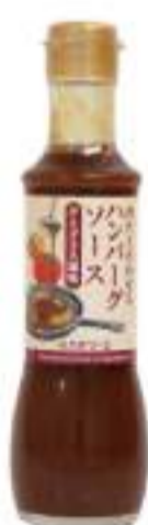
ハンバーグソース デミグラス風味