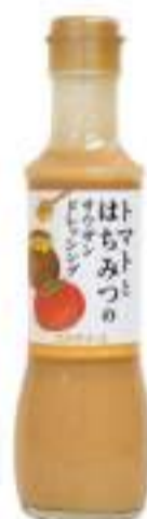
トマトとバジルのパスタサラダドレッシング