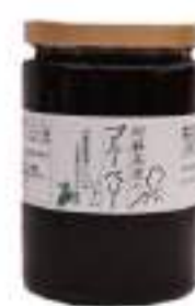
阿蘇高原のブルーベリージャム