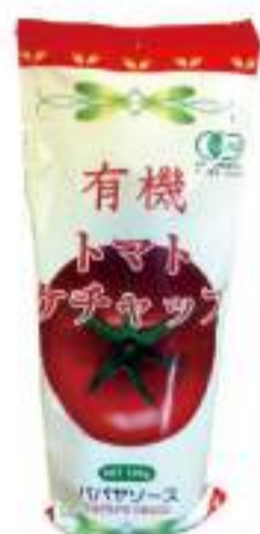
有機トマトケチャップ