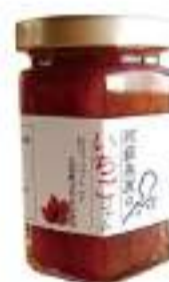
阿蘇高原のいちごジャム

【内容】阿蘇高原のいちごジャム 1kg/阿蘇高原のブルーベリージャム 1kg/ 各1個